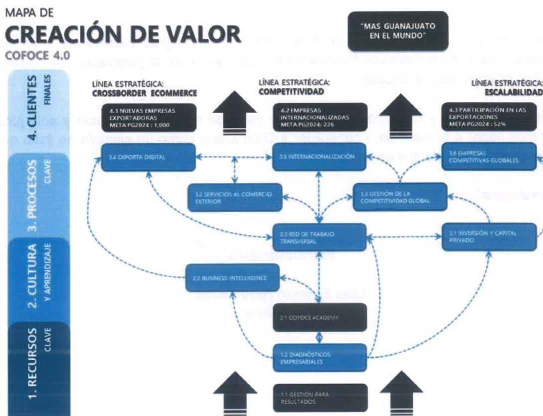
Figura 1 – Modelo de creación de valor de COFOCE.

A continuación se muestra de manera sencilla la interacción de los procesos clave en COFOCE a manera de un mapa de creación de valor para las empresas y la sociedad guanajuatense: