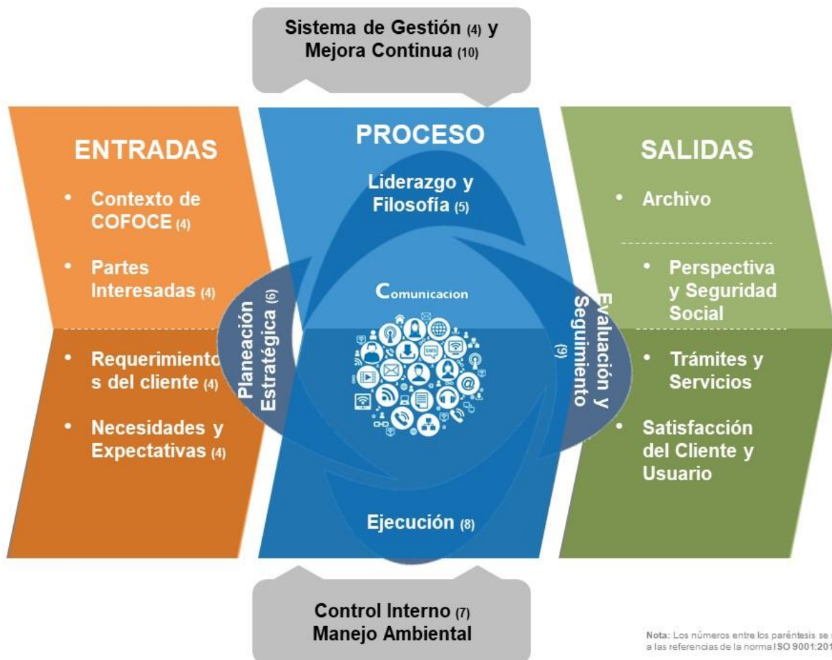
Figura 1 – Modelo de gestión basado en procesos de COFOCE.

En COFOCE utilizamos el enfoque de procesos para entender y satisfacer las necesidades de nuestros usuarios, definir el valor agregado que generamos con nuestros trámites y servicios, alcanzar la efectividad de nuestras acciones, y mejorar continuamente en función de indicadores clave.